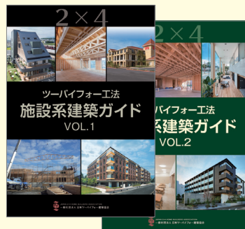
「ツーバイフォー工法 施設系建築ガイド VOL.1.2」

● さまざまな用途で採用されているツーバイフォー工法による施設系建築の事例を紹介したガイドブック