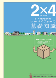
「ツーバイフォーの基礎知識」

● さまざまな用途で採用されているツーバイフォー工法による施設系建築の事例を紹介したガイドブック