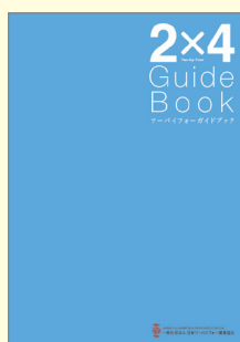
「ツーバイフォーガイドブック」

● ツーバイフォー工法の性能や建築工程等を解説したエンドユーザー向けパンフレット