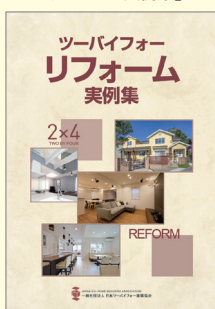
「ツーバイフォーリフォーム事例集」

● ツーバイフォー工法の性能や建築工程等を解説したエンドユーザー向けパンフレット